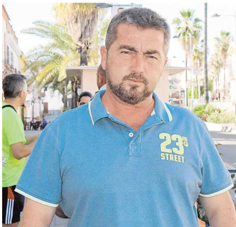
El alcalde dice que sin minas harán falta comedores sociales C.ROMERO

Boliden cesaba definitivamente su actividad en 2002 y tras un acuerdo suscrito el 18 de julio de ese año se prejubiló a 308 mineros, mientras a otros 109 se les garantizó una renta compensatoria hasta su recolocación, bajo la supervi-