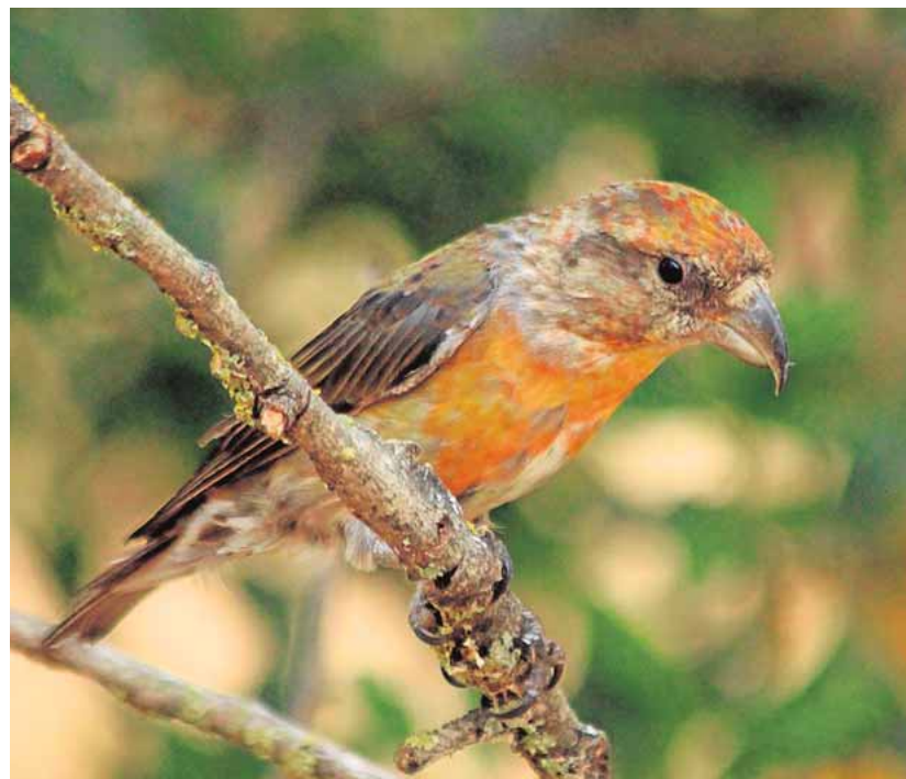
Estepa es la única zona de la provincia donde vive el piquituerto

La zona de Estepa es la única en la provincia de Sevilla donde vive el piquituerto. Este pájaro, muy semejante a un gorrión pero de mayor tamaño, es todo un especialista para alimentarse en los bosques de coníferas con su curioso pico de mandíbulas cruzadas. Expertos de toda España se han acercado a la localidad para estudiar su comportamiento. El piquituerto se ha convertido en el emblema del centro ornitológico de la Sierra Sur, ya que tiene una gran población en la Sierra del Becerrero.