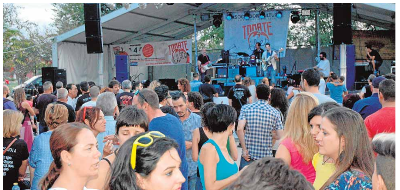
Uno de los conciertos de la pasada edición del Tomate Blues

Gran expectación Se espera superar las seis mil personas que visitaron el festival palaciego el pasado año