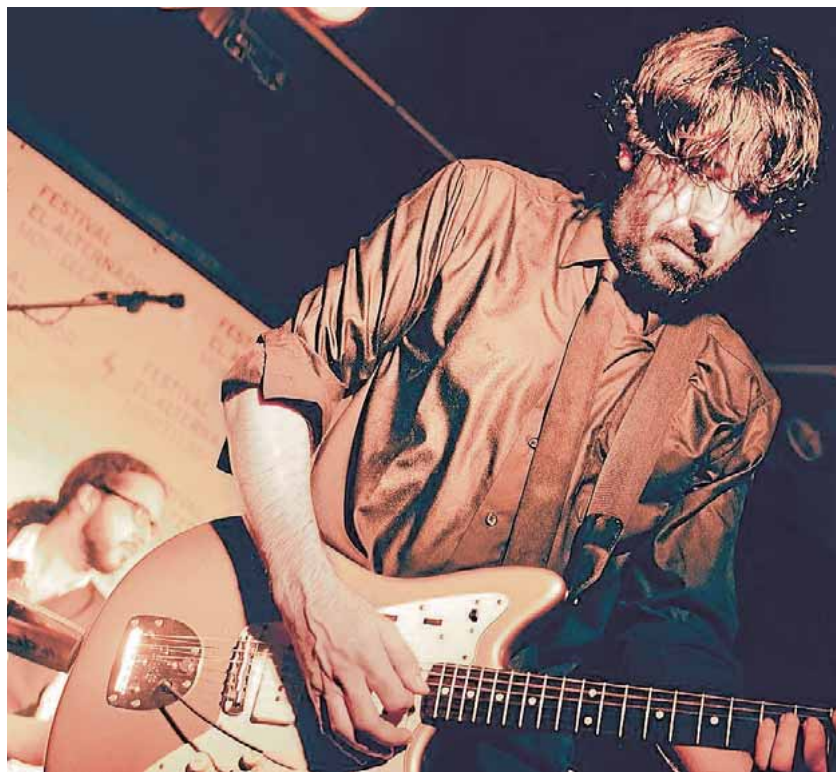
Una actuación celebrada durante la última edición del festival RAFAEL MARCHENA

Para esta edición en la que celebran la década, han querido contar con un cartel muy especial. «Está encabezado por unos históricos de la escena nacional, como son Airbag. Junto a ellos, contaremos con un amplio abanico de interesantes y muy personales propuestas del panorama musical independiente». El cartel lo completan las bandas Autos Detroit, The