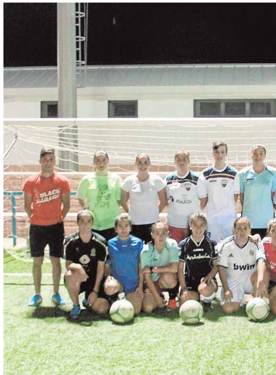
Las integrantes del Marchena Balompié posan antes de un entrenamiento