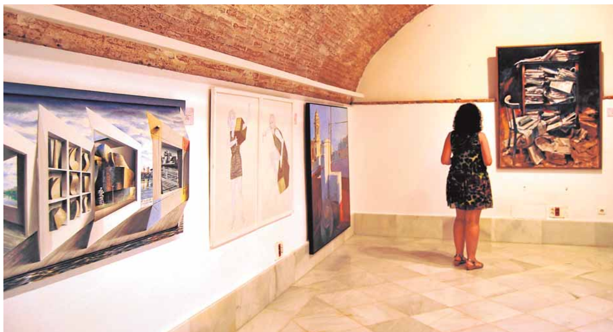
la exposición se exhibe en la sala «Bajos del Ayuntamiento»

La pieza ganadora pasa a propiedad del Ayuntamiento y de esta forma engrosa la colección pictórica municipal. Se ha creado así una notable colección municipal con más de 250 obras en la que figuran algunas de las firmas más representativas de la creación plástica española y en particular andaluza y que en conjunto representan las corrientes más significativas del siglo XX. Muchas de estas piezas pueden verse de forma permanente en el Patio de la Casa de la Cultura y otras se reparten por distintas estancias municipales.