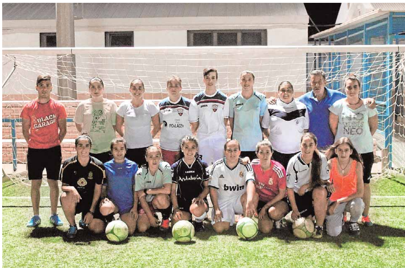
Retrato de familia, aún sin equipación, del nuevo equipo femenino de Marchena, que se estrena este sábado J.LMÁRMOL

y las distintas reconversiones que ha sufrido este sector, más de mil vecinos se hallan en paro, esperando la reapertura de la corta de Los Frailes, «nuestra única salvación», dicen. [2]