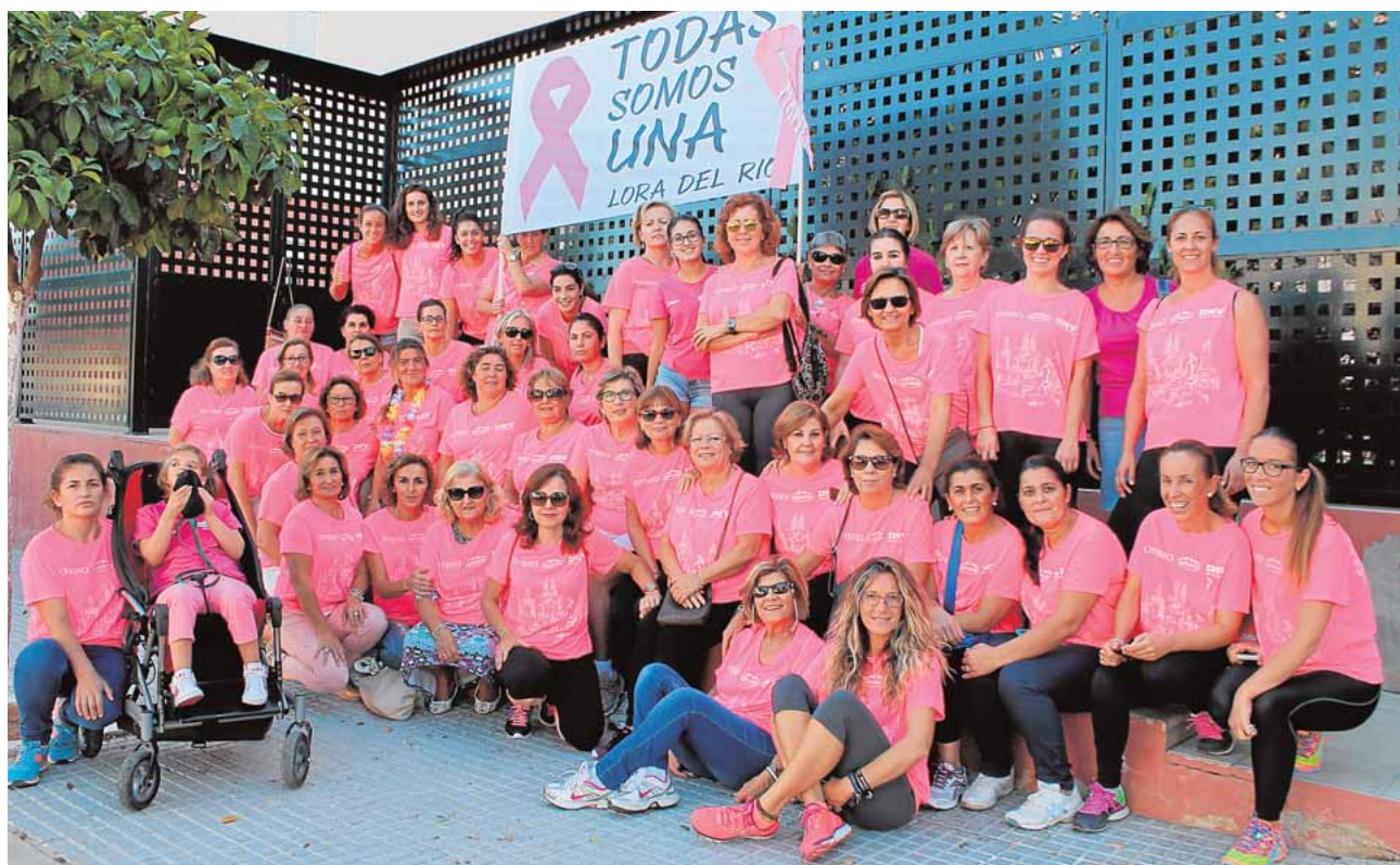
Algunas de las mujeres que participarán en la Carrera de la Mujer de Sevilla este domingo

colegio conocido como «Los lápices». Entre las actuaciones se llevarán a cabo están el entubamiento del canal existente evitándose así las inundaciones en la zona. La obra se financiará a través del PFOEA y tendrá un coste de 161.071 euros.