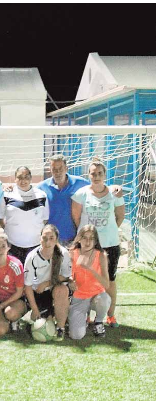
J. L. MÁRMOL

viernes en la localidad de Marchena. Lo hará con la proyección de las películas «Atrapa la bandera», una película de animación española que ha triunfado este verano, y con la cinta de terror «La visita», de M. Night Shyamalan.